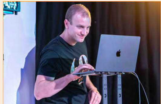
▲ Bellermusic Sono, éclairages et musiques vraiment au top bellermusic.ch