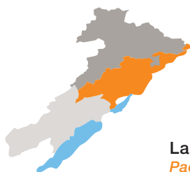
La carte des membres Page 5