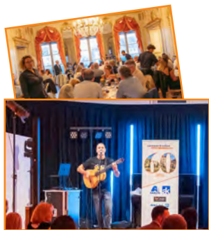
L'événement en 9 images Pages 1 et 2