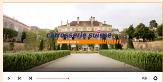
▲ Mystik Le 29 août en 60 secondes (Aftermovie) mystik.swiss