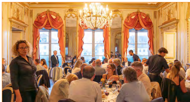
Comme dans un conte de fées: les petits plats dans les grands... Les papilles gustatives des convives s'en souviendront longtemps... très longtemps!