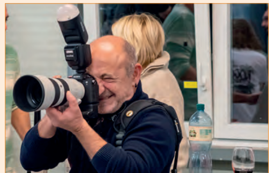
▲ Pino Stranieri Plus qu'un photographe, un ARTISTE! erblicken.ch Pino Stranieri est le photographe de carrosseriesuisse.ch