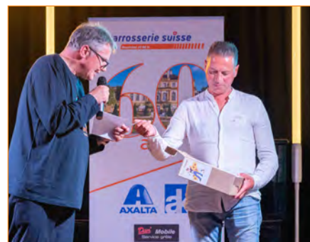
Dernière épreuve: la tombola. 10 convives repartiront les mains bien pleines!